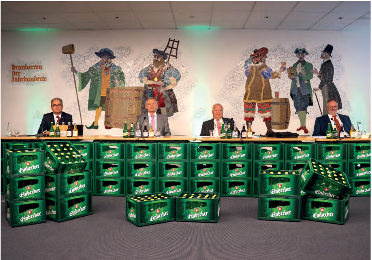
Unsere Hauptversammlung 2020, die erste virtuelle Hauptversammlung der Getränkebranche