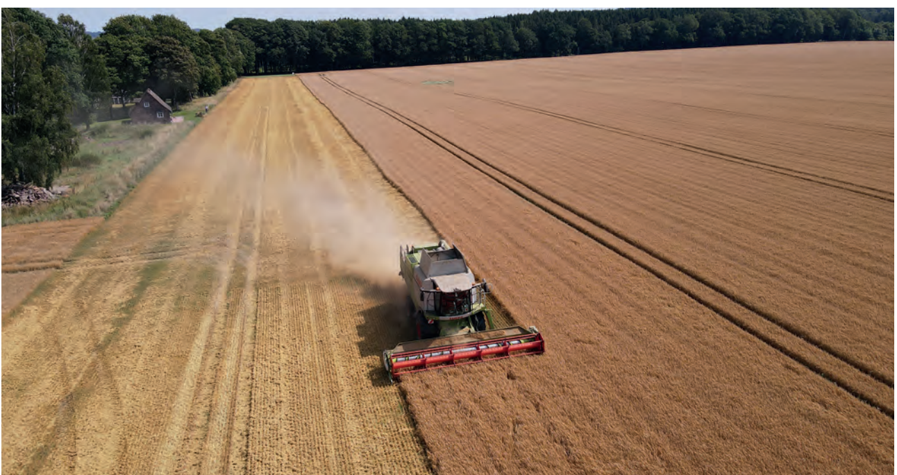
Bilder von der Aussaat bis zur Ernte der regionalen Braugerste 2021