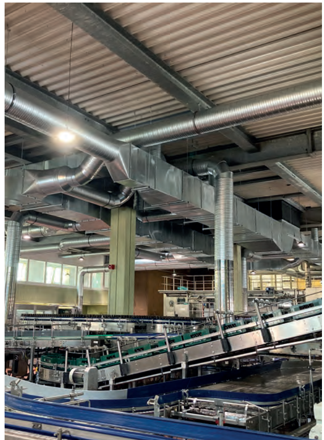
Dach und Decke des Abfüllgebäudes mit den beiden Abfüllanlagen für Flaschenbier wurden in 2021 komplett erneuert. Eine neue Lüftungsanlage sorgt mittels neuer Lüftungsrohre für gute Raumlufbedingungen.