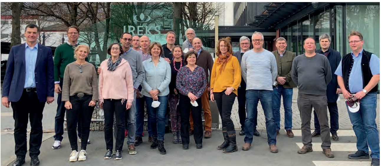
Projekt regionale Braugerste: Die teilnehmenden Landwirte und Mitarbeiter der Einbecker Brauhaus AG informieren sich in der Mälzerei IREKS in Kulmbach über die Weiterverarbeitung der angebauten Gerste zu Malz.