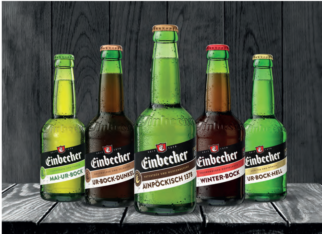
Die neue Ausstattung für unsere 5 Einbecher Bock-Biere. Zum Einsatz kommen zukünftig weniger und natürlichere Ausstattungsmaterialien. Die Erkennbarkeit unserer Marke und Sorte wurde deutlich verbessert.

Nach dem Bilanzstichtag sind keine wesentlichen Ereignisse eingetreten, welche die Ertrags- und Finanzlage der Gesellschaft betreffen.